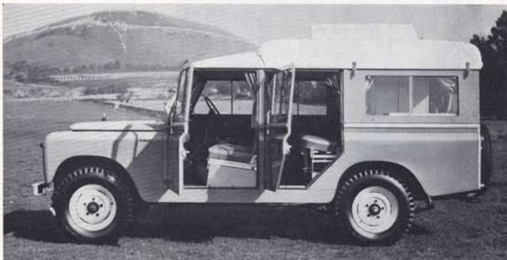
Dormobile Caravan, with elevating roof closed.

Pour le confort de vos couchages, les facilités prévues pour faire la cuisine, la toilette, spécialement réservée pour assurer le transport d'eau et des bagages, le Land-Rover Roulotte DORMOBILE est le véhicule idéal, et quelque soit l'itinéraire de la route où la destination, pour les vacances, la chasse et la pêche, les entreprises de tourisme et les expéditions en exploration, les usages sont innombrables.