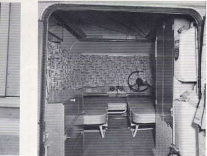
Converted for sleeping two single beds.

Esta Caravana DORMOBILE, cuyas características únicas han sido probadas y aprobadas por muchos miles de usuarios en todas partes del mundo, combinan perfectamente con el carácter de uso universal del famoso Land-Rover, y es por consiguiente un vehículo de suprema adaptación y dureza, especialmente indicado para viajes cómodos de turismo de cuatro adultos, en cualquier parte.