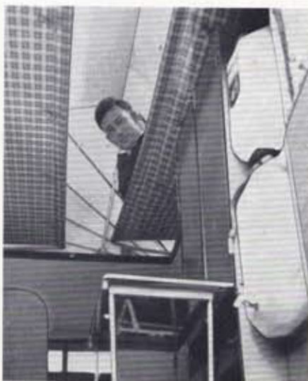
Two Folding Bunks below elevated roof.

With sleeping, cooking and washing facilities, water supply and storage accommodation the Land-Rover DORMOBILE Caravan is completely independent of fixed routes or locations, and makes it an ideal vehicle for holidays, hunting and fishing trips, surveying and long distance expeditions over undeveloped terrain, and countless other uses.