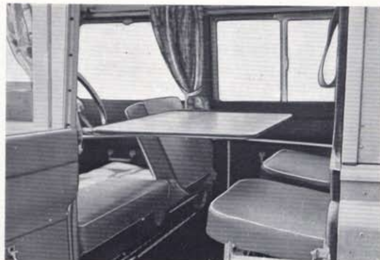
Folding table, erected for meals, or writing, etc.